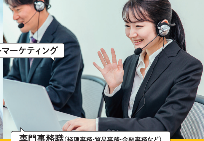
テレマーケティング