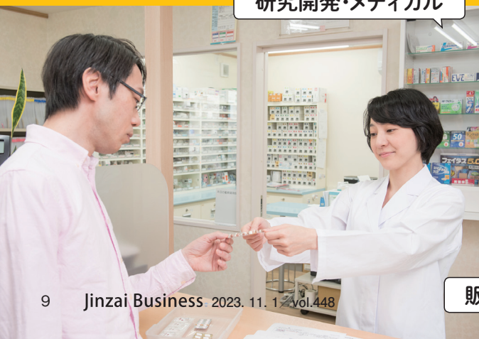
研究開発・メディカル

■調査概要■ ●実施期間・・・2023年9月22日～27日 ●有効回答数・・・4000人 ●男女比・・・男性1320人(33.0%)、女性2680人(67.0%) ●年齢比・・・10代:5人(0.1%)、20代:339人(8.5%)、30代:841人(21.0%)、40代:1396人(34.9%)、50代:1419人(35.5%) ●雇用形態・・・有期雇用:2695人(67.4%)、無期雇用:1305人(32.6%) ※回答率(%)は、小数点以下第2位は四捨五入により、小数点第1位までを表示しています。そのため、合計数値は100%にはならない場合があります。