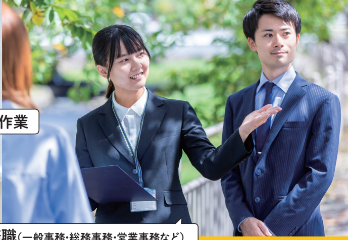
事務職(一般事務・総務事務・営業事務など)